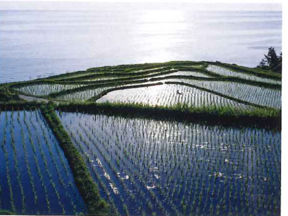
左・「銀すし」のにぎり。ネタは玄界灘のものが中心。右・夕日に輝く、石川県輪島市の白米千枚田。

☎0768(22)8133 大堤65-1 ☎088(685)7603 7-3 ☎076(264)3422 73)3835 ☎054(366)6083 ☎0799(72)5544 6-3 ☎0955(56)8288 7-20-1 札幌スカイビル